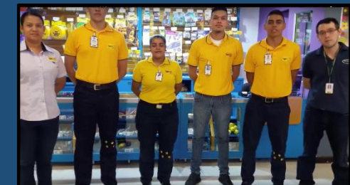
Cultura Happy – HC Aventura