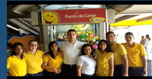
Soy Comercial – HC Cosmocentro & Palmetto