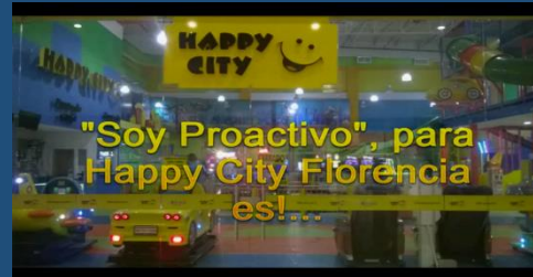
Soy Proactivo – HC Florencia