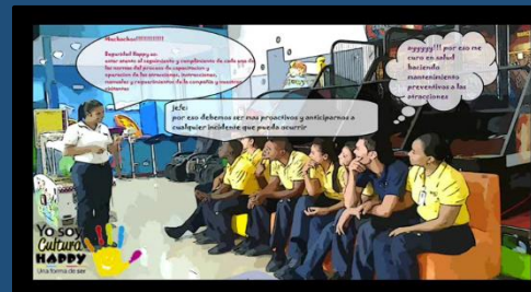
Soy Seguro – HC Nuestro Urabá