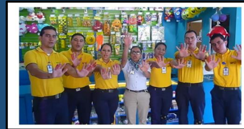
Soy Ordenado – HC Pitalito