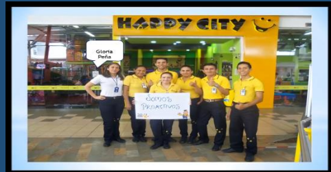
Cultura Happy – HC Alcaravan