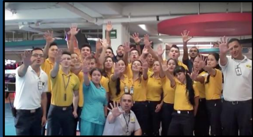
Soy Comercial – Tesoro Encantado