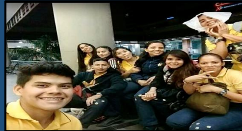
Soy Amable - Cali