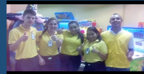
Cultura Happy – HC Mayorca