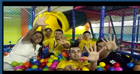
Soy Ordenado – HC Calima