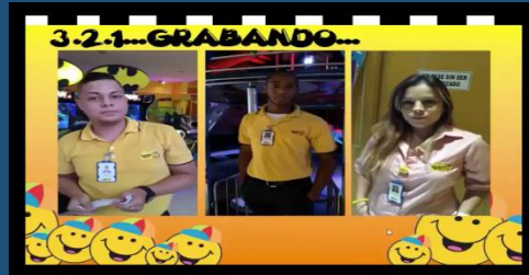
Soy Proactivo – HC Santafé