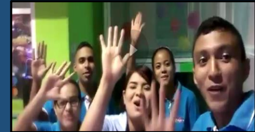
Cultura Happy – Nuestro Montería