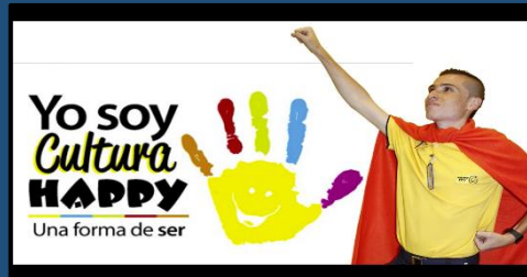
Soy Amable – HC Fundadores & HC Pereira