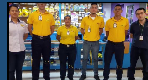
Cultura Happy – HC Aventura