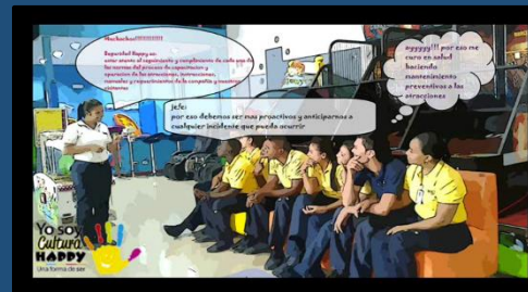
Soy Seguro – HC Nuestro Urabá