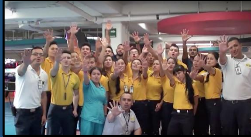
Soy Comercial – Tesoro Encantado