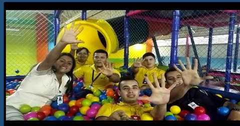
Soy Ordenado – HC Calima