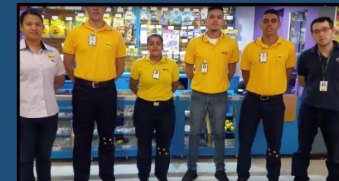
Cultura Happy – HC Aventura